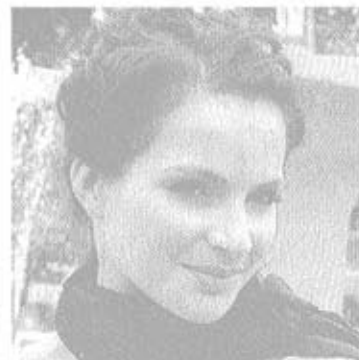
Anna Dereszowska Piękna aktorka zagrała główną rolę w filmie „Nigdy nie mów nigdy”