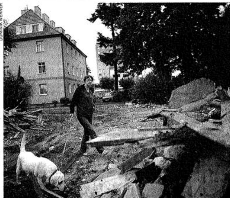
Anna Smyk-Kaluźna spacerowała wczoraj z psem po gruzach, które zostały po wyburzeniu budynku przy ul. Słowackiego 32A

- Prace rozbiórkowe prowadzone będą na całym odcinku od ul. Potokowej do al. Rzeczypospolitej - informuje Romuald Nietupski, prezes spółki GIKE 2012, odpowiedzialny za realizację miejskich inwestycji związanych z Euro 2012.